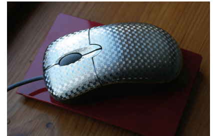
Galvanisierte, strukturierte Oberfläche auf glatter Kunststoffoberfläche

Der zunehmende Wunsch nach Variantenvielfalt und Individualisierung macht die Dekoration von Spritzgussteilen immer wichtiger. Immer neue Dekorationsverfahren für glatte oder strukturierte Oberflächen werden den wachsenden Anforderungen an Design und Haptik bei gleichzeitig steigenden Qualitätsansprüchen gerecht. Über die Optik hinaus lassen sich mit Galvanisieren, In-Mould-Dekorieren oder Folienhinterspritzen viele Funktionen von Kunststoffbauteilen verbessern, z.B. Barriereigenschaften, Abriebfestigkeit, Dämmung und Lebensdauer. Die Auswahl der Dekorationsverfahren sind Bestandteil der Produktentwicklung, da sie nicht nur Änderungen der Formteildimension zur Folge haben, sondern auch besondere Ansprüche z.B. an Füllverhalten und Material- bzw. Oberflächenqualität stellen.